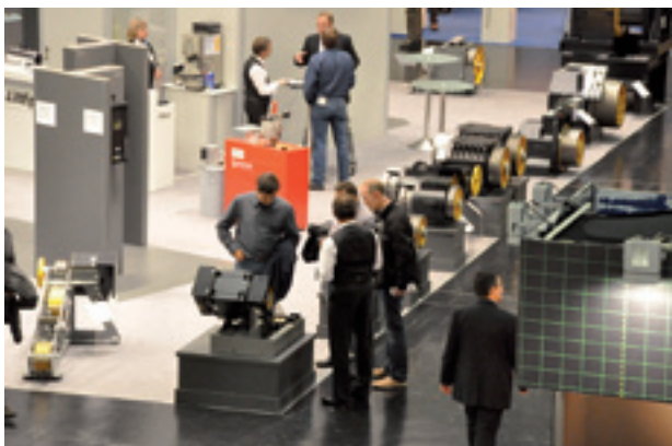
All construction sizes of the gearless drives are showcased impressively in one range; the delicate PMC 145 is at the front

Two years ago LiftEquip introduced the modernisation package ModKit MO61 which allows the replacement of existing elevators with a geared drive and suspension 1:1 with a gearless drive (PMC gearless 145) and suspension 2:1. The customer's marginal conditions, as well as ceiling opening, car sling and counterweight, must not be modified in the process. The range of options has been