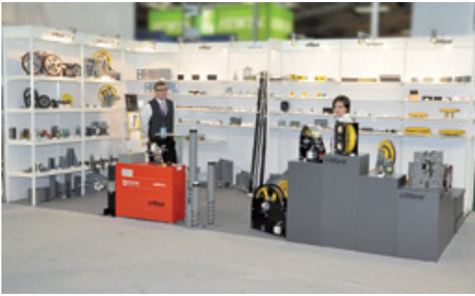
The additional trade fair stand with the large range of small parts for elevators – it's almost like a supermarket!

enhanced once again and now ranges from 320 to 1,000 kg and from 1.0 to 1.6 m/s, in suspensions 2:1 and 1:1. With another new modernisation kit it is now easier than ever to replace the geared drive with a PMC gearless up to 630 kg carrying force. The frame of the gear, for example the TW 45, can be used again and the suspension in 1:1 is retained. With this a wide range of existing traction elevators which have to be retrofitted in the course of the safety assessment is covered.