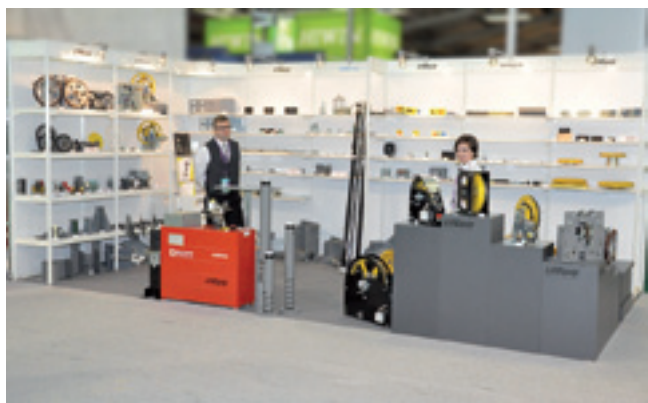
Der zusätzliche Messestand mit dem großen Spektrum an Aufzugskleinenteilen – fast wie in einem Supermarkt

Tragkraft noch einfacher als bisher möglich. Der Rahmen des Getriebes, z. B. der TW 45, kann weiterverwendet werden und die Aufhängung in 1:1 bleibt erhalten. Damit wird ein breites Segment bestehender Seilauzüge, die insbesondere im Zuge der sicherheitstechnischen Bewertung umgebaut werden müssen, abgedeckt.