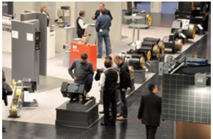
Alle Baugrößen der Gearless-Antriebe sind eindrucksvoll in einer Reihe aufgestellt; im Vordergrund die zierliche PMC 145

Eine der zentralen Herausforderungen für die gesamte Branche ist die Umsetzung des neuen Standards DIN EN 81-1/2 A3: Aufzüge, die ab dem 01.01.2012 in Betrieb genommen werden, müssen mit einem System ausgestattet sein, das eine unbeabsichtigte Bewegung des Fahrkorbs bei geöffneten Türen auf maximal ca. einen Meter begrenzt. LiftEquip bietet unter dem Stichwort Sicherheitskonzept UCM (Unintended Car Movement) bereits Lösungen für alle Antriebsarten an, von der Hydraulikanlage, über den Getriebeantrieb bis zum getriebelosen Aufzug. Welche zertifizierten Komponenten man für das jeweilige Antriebssystem einsetzt, wird in einer Broschüre übersichtlich dargestellt und kann unter www.EN81-A3.com eingesehen werden.